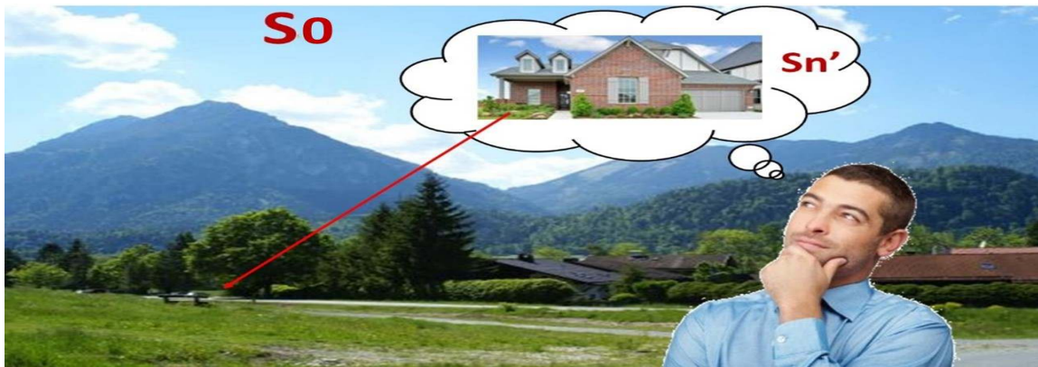
Gráfico 1: Situación Inicial (S0) y Situación Deseada (Sn') en una Teoría de la Acción

Veamos en el gráfico 1 un ejemplo que sintetice lo dicho hasta aquí, que por ahora no tiene nada que ver con las investigaciones sino con las acciones humanas racionales en general.